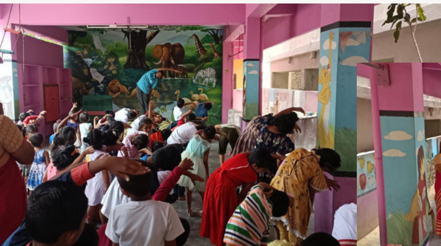
Mom's Touch Play School, Bapatla