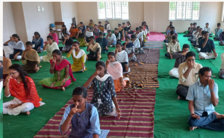
Agricultural Engineering College, Bapatla