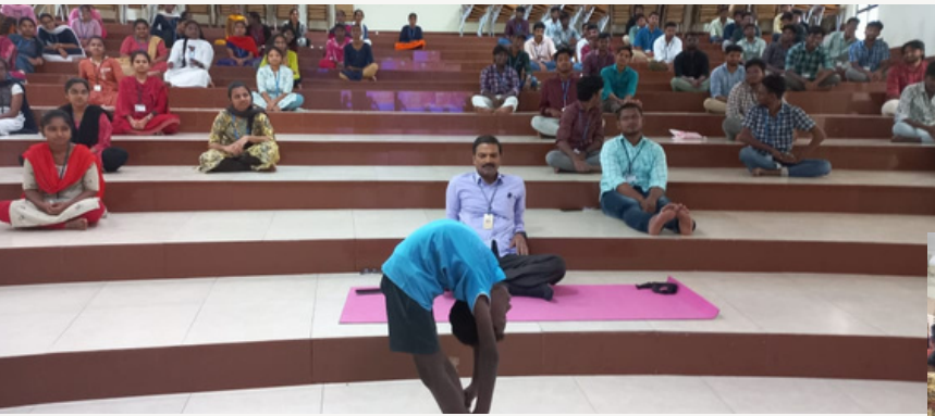
Bapatla Engineering College, Bapatla