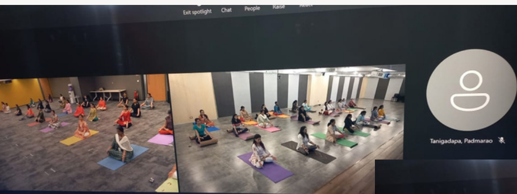
Yoga Day in AMD company - Online