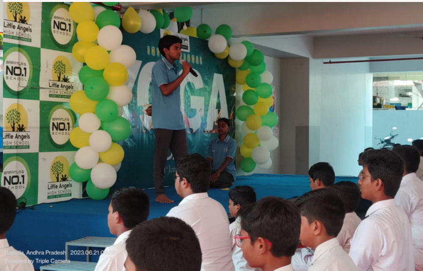
Little Angels High School, Bapatla